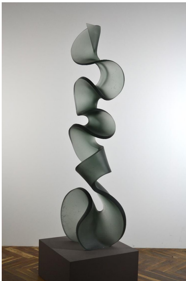
Kouř, Tavené, broušené sklo, 2018, Výška: 180 cm cm.

Galerie Kuzebauch 18/09 2019 – 08/11 2019