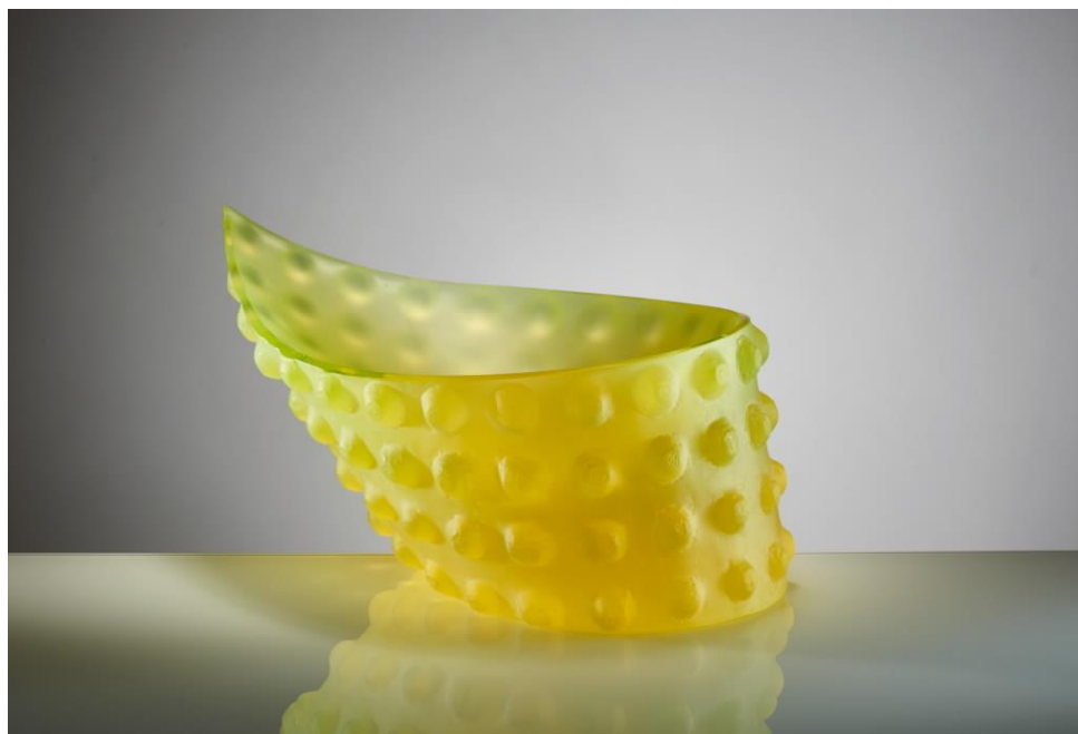
List, tavené, broušené sklo, 2019, 15 x 27 x 19 cm.

Její skleněné objekty, často v jasných dominantních barvách, jsou dynamické a životné. I ve své kontemplativní podobě v sobě skrývají energii pohybu, jsou zachyceným obrazem okamžiku, neopakovatelnou momentkou, mrknutím oka.