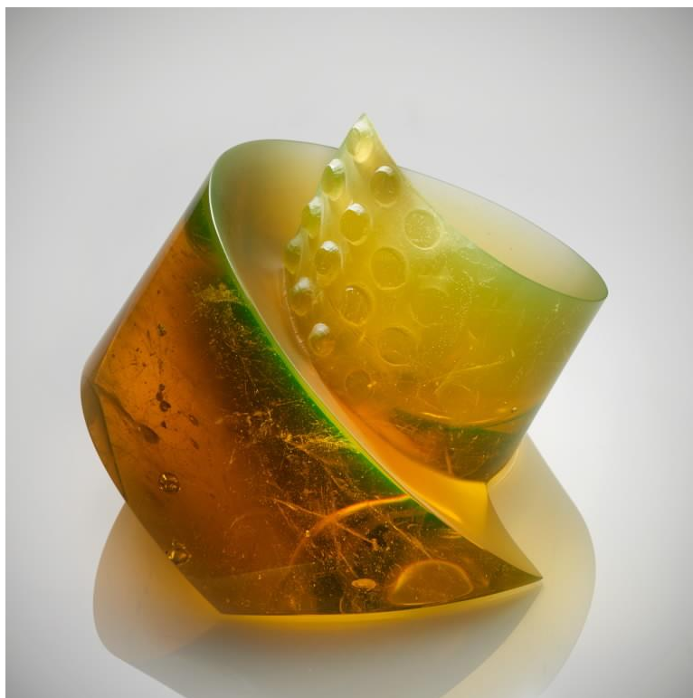
Šnek, tavené, broušené sklo, 2019, 23 x 30 x 30 cm.

Partnerem galerie Kuzebauch a výstavy je Muzeum skla a bižuterie v Jablonci nad Nisou