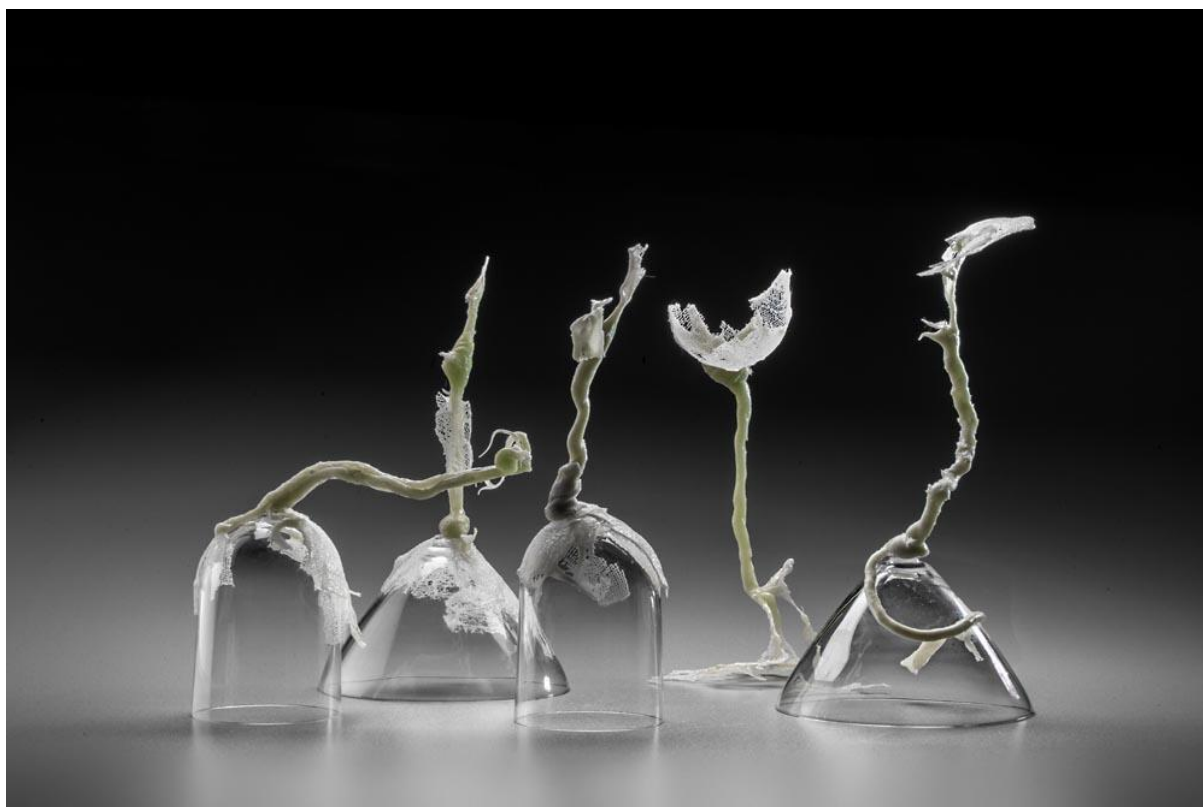
Biorytmy, 2017, tavená skelná textilie, foukané sklo, výška: 8 cm – 16 cm

Galerie Kuzebauch 10/11/2017 – 07/01/2018