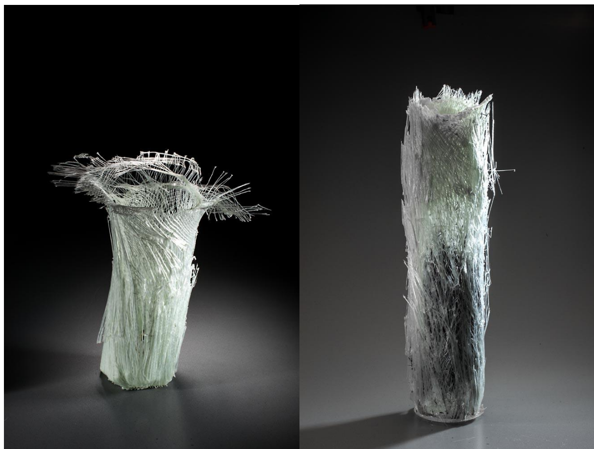
Polyp, 2017, tavená skelná textilie, 25 x 8 cm, Foto: Gabriel Urbánek Polyp II, tavená skelná a čedičová textilie, pryskyřice 50 x 12 cm, Foto: Gabriel Urbánek